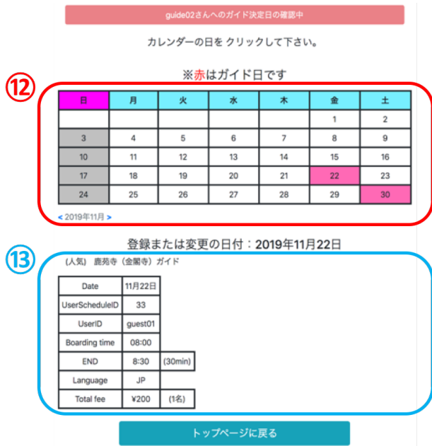
図 9 ガイド予約の確認画面

ガイドの登録日である。また、赤色の日付をクリックすると⑬に詳細な登録情報が表示される。この予定確認によりガイドは登録した POI やガイド時間、参加人数などの設定を一目で把握できるためスケジュール管理のサポートになり、気軽に POI 登録を行うことができるようになると考えられ、ガイドシェアリングサービスのガイド側の満足度の向上が期待できる。