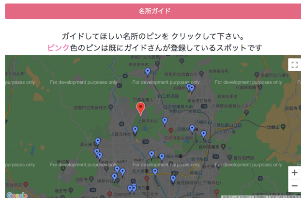
図 10 リアルタイムでの周辺 POI の推薦

の 2 種類の検証方法で行った。(1) の検証方法の Category および Objective とは、検証に利用するデータに含まれるデータ項目である。Category は一人、家族、恋人、仕事仲間などの 8 種類、Objective はレジャー、ビジネス、その他の 3 種類を