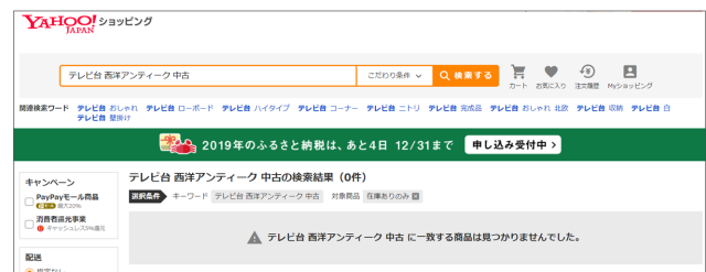
図1 商品検索におけるゼロマッチクエリの例

なってしまう原因に依存するため、様々である。例えば、条件を絞り込みすぎたクエリに対しては、その絞り込みを緩和するために、検索クエリ中の不要な単語を削除する手法が適している。一方、入力誤りをしてしまったクエリに対しては、スペル修正をおこなう手法が効果的である。このように、どのようなゼロマッチクエリに対してどういった手法を適用するのが最適なのか、すなわち類型化された書き換え方法の中から最も適している方法を自動判別するシステムを構築することは、Eコマース検索エンジンの精度向上のために不可欠である。しかし、そのような研究は我々の知る限りまだ存在しない。そこで本研究では、まず実際のゼロマッチクエリの分析により、これらを適切に書き換える方法を類型化する。さらに、あるゼロマッチクエリが与えられたときに、このような自動判別システムを構築する上で必要な、ゼロマッチクエリと書き換え方法の類型とのペアからなるデータセットを構築する。書き換え方法の類型は、(1)単語削除、(2)単語置換、(3)完全な書き換え、(4)誤り修正、(5)その他、とし、クラウドソーシングにより各ゼロマッチクエリに付与する。最後に、構築したデータセットと機械学習モデルに基づく分類器を用いてゼロマッチクエリを分類する。